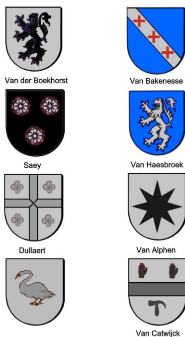
Afb. 1. Impressie van de kwartierwapens op de grafzerk van Vranck van der Boekhorst.

In de kerk van Noordwijk binnen ligt de grafzerk van Vranck van der Boekhorst met daarop aangebracht acht kwartierwapens, die zijn uitgekapt. 6 De kwartierwapens zijn door Arnout van Buchel nagetekend. 7 Op basis hiervan is een tekening van de wapenschilden in kleur – voor zover bekend – gemaakt (afb. 1).