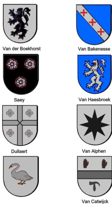
Afb. 7. Impressie van de kwartierwapens op de grafzerk van Vranck van der Boekhorst.