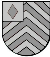
Afb. 14. Tekening van het zegel van Dirk de Weent Dirksz. (1402).

1408 zegelt Dirk de Weent als leenman van de abdij Egmond. 185 Idem op 11 april 1409. 186 Aan al deze charters hangt zijn zegel, waarvan een tekening is gemaakt (afb. 14). 187