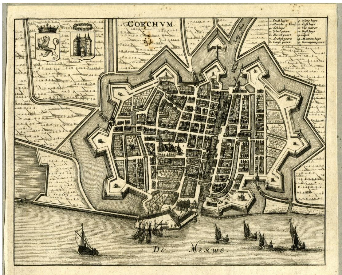
Plattegrond van Gorinchem in 1610.

In alle gevallen luidt, bij onduidelijkheid of onzekerheid, steeds het advies: raadpleeg de originele indexen.