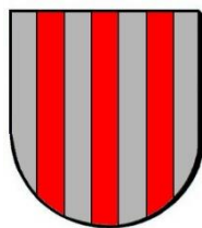
Afb. 1. Het algemeen wapen van de familie Van Berchem (Ranst).

Van de meeste leden van de familie zijn, zoals hiervoor al is vermeld, zegels bewaard gebleven, waaruit blijkt dat het heraldische wapen van de familie Van Berchem drie palen vertoont en wordt beschreven als ‘in zilver drie palen van rood’ (afb. 1). 5