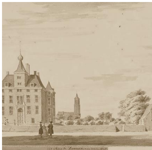
Afb. 1. Het Huis te Zoelen (1728). 4

Zowel in Zoelen als in Avezaath lag een versterkt huis. Beide huizen werden tussen 1290 en 1296 door de volgelingen van de graaf van Vlaanderen ingenomen. In 1355 werden ze door hertog Eduard vernield. 3