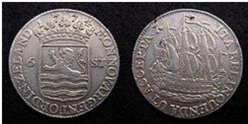
Scheepjesschelling van Zeeland, zilver, 1774, geslagen te Middelburg.

Op 9 november 1670 besloten de Staten van Holland tot een sanering, omdat er inmiddels te veel minderwaardige schellingen in omloop waren. De Statenvergadering besloot tot aanmunting van een schelling van betere kwaliteit, met op de voorzijde het provinciewapen en op de keerzijde een "een gemonteerd schip van oorlog". Men wilde met deze nieuwe schelling de status van de Republiek als zeevarende mogendheid benadrukken. Het ontwerp van het stempel was van Daniël Drappentier. Deze schelling met een zilveragehalte van 583/1000, al gauw SCHEEPJESSCHELLING genoemd, werd een succes omdat deze ook internationaal breed ingang vond en bovendien in de handel op de Oost zeer gewild bleek. Over de scheepjesschellingen ging het volksverhaal dat zij geslagen waren ter ere van de verovering van de Spaanse Zilvervloot. Dat was ongeloofwaardig, daar dat wapenfeit al meer dan 40 jaar voor de eerst geslagen scheepjesschelling had plaatsgevonden.[2] In de loop van de 18e eeuw gingen ook Utrecht, Zeeland en Gelderland, zij het aarzelend, over op aanmunting van de SCHEEPJESSCHELLING.