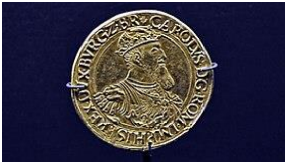
Een gouden carolusgulden, geslagen in 1552 (Museum aan de Stroom).

In 1521 voerde keizer Karel V een munt in die naar hem de carolus wordt genoemd. De gouden carolus is onderverdeeld in 20 stuivers van 16 penningen, een indeling die bijna 300 jaar ongewijzigd bleef. In Nederlandse teksten van vóór 1816 vindt men dus wel bedragen als f 10-12-4, ofwel 10 gulden, 12 stuivers en 4 penningen. Dit komt overeen met f 10,6125 in het decimale stelsel.