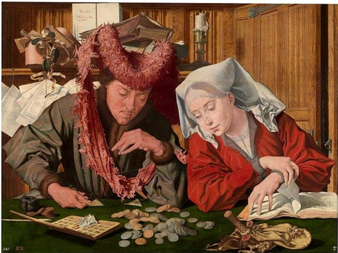
Marinus van Remerswale: de geldwisselaar en zijn vrouw (eerste helft 15 e eeuw)

in de 15e eeuw ontstonden zogenaamde Bergen van Barmhartigheid. Dit waren instellingen die mensen in geldnood in bescherming namen. Deze ‘banken van lening’ hadden geen winstogmerk aangezien dit nog erg gevoelig lag bij de kerk. De komst van deze banken maakte een einde aan de kredietverleningen met zeer hoge rente van de Lombarden.