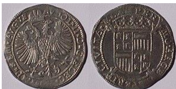
Arendschelling van zes stuivers, zilver, geslagen te Kampen ca. 1595.

In de Republiek der Nederlanden werden vanaf 1581 opnieuw schellingen geslagen met een waarde van zes stuivers. Er waren in diverse provincies verschillende typen in omloop: ridderschellingen, arendschellingen, roos- hoedjes- en snaphaanschellingen. De snaphaanschelling was het eerste type schelling, geïntroduceerd door Gelderland, op basis van de hiervoor genoemde door Gelre geslagen snaphaan. Vanaf 1595 begon Kampen met een eigen type schelling dat de rijksadelaar en de keizersnaam weergaf: de arendschelling. Al spoedig volgden Nijmegen, Zwolle en Friesland. Deze schelling bleef beperkt tot Oost-Nederland, maar was ook in het Duitse achterland geliefd. Arendschellingen waren nog lang populair als "bakerschellingen". De voor zijn waarde grote schelling was bij uitstek geschikt als gift bij kraamvisites om zo "een bakers hand behoorlijk te vullen".