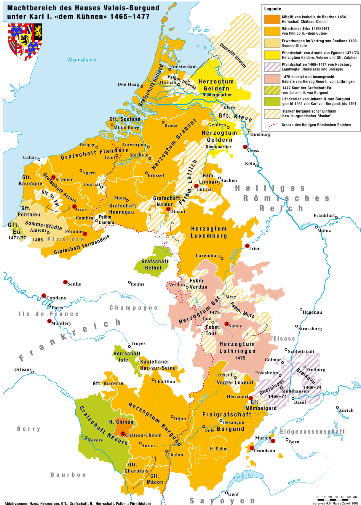
Het Bourgondische Rijk op haar sterkst (±1475)