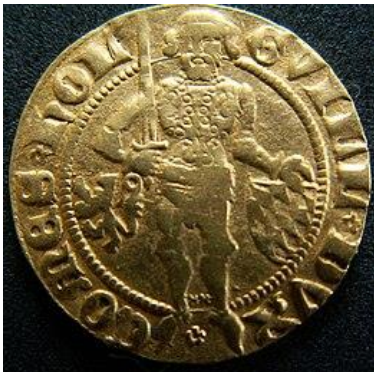
Guldgulden graaf Willem V (1378-1389)

Filips de Goede legde de gulden vast als basis van de munteenheden in de Nederlanden. Door de verschillende privileges die de gesten hadden, sloegen aan het einde van de 15e eeuw alle Nederlandse gewesten hun eigen guldens, met uitzondering van Groningen. Groningen en Oost-Friesland bleven tot de 17e eeuw de Emdense munt gebruiken; Groningen bleef de kromstaart gebruiken.