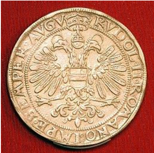
Groningse rijksdaalder uit 1602

De oudste daalders waren zware zilveren munten van goede kwaliteit. Al in de 16de eeuw had de Nederlandse daalder een waarde van dertig stuivers, die in de waarde van 1,5 gulden tot op heden is gehandhaafd.