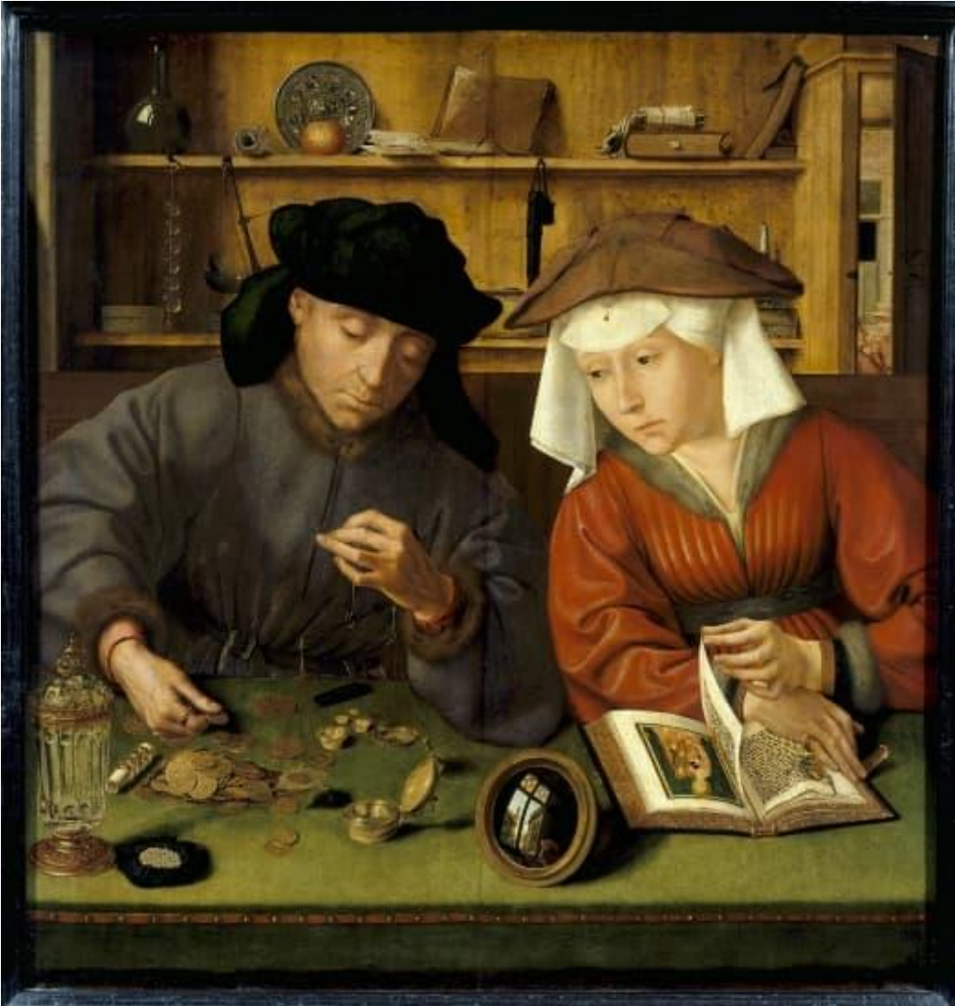
Versie 2. Samenstelling: Max Mesman (juli 2024)