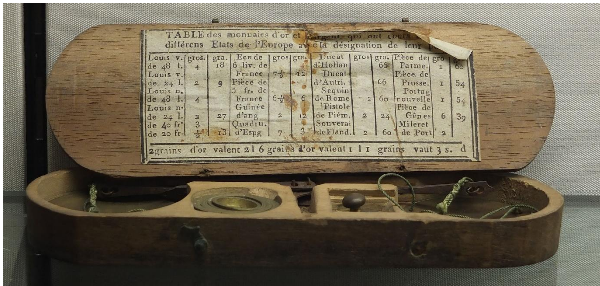
Muntgewichtendoos met weegschaal en diverse gewichten. Staal en koper 1780-1820.

Om ontduiking van het verbod te voorkomen, werden in 1693 alle omlopende florijnen ingestempeld met provinciennaam of -wapen of met een pijlenbundel en werd het gebruik van ongeklopte exemplaren verboden. De geklopte florijnen bleven geldig voor 28 stuiver. Zij zijn tot de intrekking in 1846 in het geldverkeer gebleven. Ten tijde van het hoogtepunt van de aanmunting zijn ook florijnen van Overijssels type geslagen door de stad Emden en door de graaf van Oldenburg.