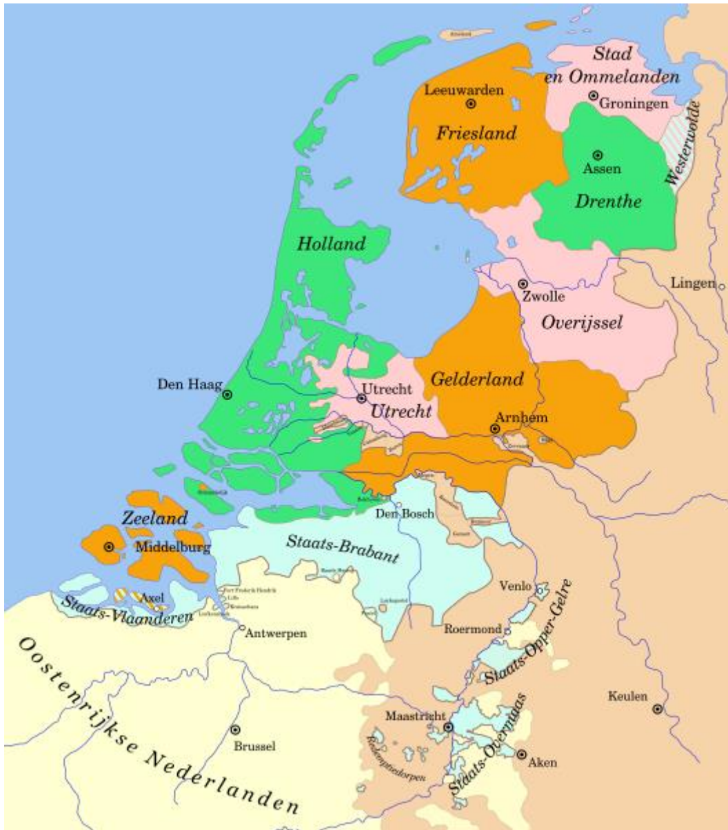
Republiek der Zeven Verenigde Nederlanden, 18e eeuw