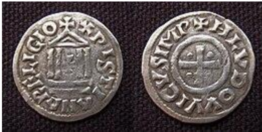
Karolingische penning of denarius, zilver, Lodewijk de Vrome, z.j. (813–840).

De herkomst van het woord penning is duister, afgezien van het algemeen Germaanse achtervoegsel -ing (vergelijk schelling).