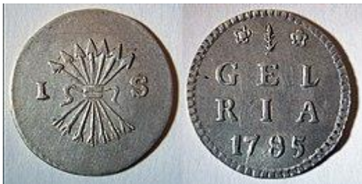
Provinciale zilveren stuiver van Gelderland uit 1785. Vanwege de pijlenbundel op de voorzijde werd dit type stuiver doorgaans "BEZEMSTUIVER" genoemd.

Stuivers werden in de Nederlandse koloniën, maar ook in meerdere Europese landen, gemunt en gebruikt. In Duitsland was STÜBER of STÜVER de naam van een kleine bronzen munt uit de 15e-19e eeuw, die eeuwenlang vooral in het Bergse Land in omloop was. In het Franse taalgebied was de patard in omloop, die met de stuiver vergelijkbaar was. Nadat de Nederlandse kolonie van Ceylon door de Engelsen was overgenomen werd daar van 1801 tot 1821 een munt geslagen die 'STIVER' heette en als vervanging van de Oost-Indische stuiver fungeerde. Eenzelfde proces veroorzaakte invoering van de 'stiver' in Demerara-Essequibo, later bekend als Brits-Guiana. Daar werd de munt geslagen tussen 1809 en 1835.