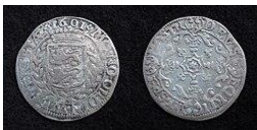
Rooschelling van West-Friesland, zilver, 1601, geslagen te Hoorn.

In 1601 werd de Arendschelling door de rooschelling opgevolgd. Deze schelling, ingevoerd door de provincie Holland in 1601, dankte zijn naam aan een roosje in het midden van een gebloemd kruis op de keerzijde van de munt. In datzelfde jaar werd het Hollandse initiatief gevolgd door de provincies Gelderland, Overijssel, Utrecht en Zeeland, het landschap West-Friesland en de stad Deventer. In Holland bleef de aanmuntung van de rooschelling tot 1601 beperkt. In West-Friesland werd de rooschelling – zij het sporadisch – nog tot 1683 aangemunt. Evenals de arendschelling bevatte de rooschelling geen waarde aanduiding.