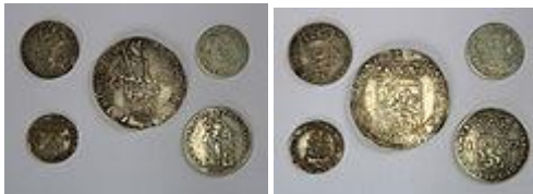
Vijf provinciale en koloniale munten uit de 17e en 18e eeuw. Voorzijde en keerzijde.